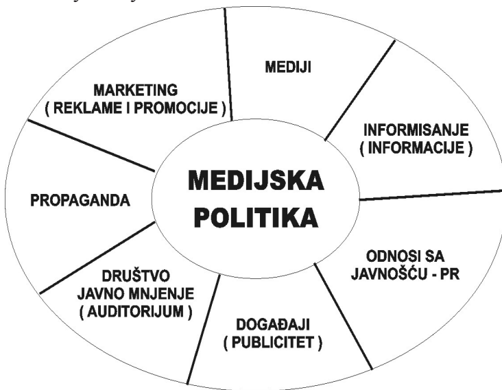
Точак медијске политике 8

комуницирању тако постаје незобилазна, штавише круцијална, јер се већина порука упућује и прима путем њих. Стога се слободно може рећи да медијска политика обухвата маркетинг, информисање јавности, односе са јавношћу и, наравно, само медијско деловање (које се често врши у форми пропаганде). Ради лакшег увида у елементе медијске политике дајемо следећу шему.