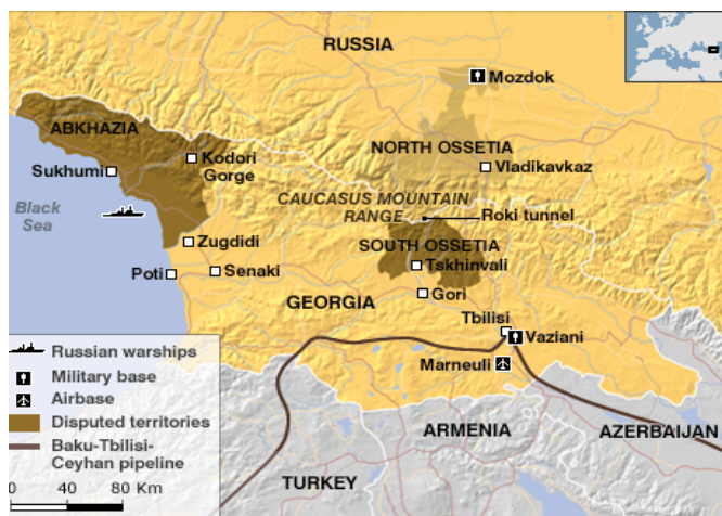
Мапа 1. Грузија и отцепљене територије 2008.2

Грузија се простире на површини од 69.700 km 2 а насељава је око 4,5 милиона становника. Грузијци чине 84%, Азери 6,5%, Јермени 5,7%, Руси 1,5%, православни 89% а муслимани 9% становништва Грузије. Граничи се са Русијом, Турском, Јерменијом и Азербејџаном (мапа 1) граничном линијом дугом 1.461 км и излази на Црно море обалом дугом 310 км. 1 Земља је подељена на девет региона и две аутономне републике (Абхазија и Ацарија). Абхазија заузима око 8.600 km 2 где живи око 200.000 становника. Ацарију насељава око 376.000, а Јужну Осетију око 70.000 житеља.