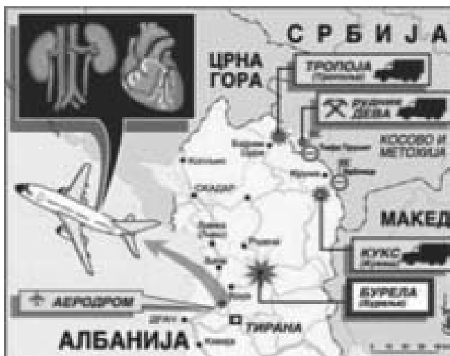
Слика 3.: Пунктови за трговину органима отетих

етничкој заједници, а потом трговали њиховим органима. Надлежни органи Републике Србије у више наврата су уверавали домаћу и међународну јавност, да располажу са релевантним сведоцима и уверљивим доказима о наведеним злочинима, (Слика 3).