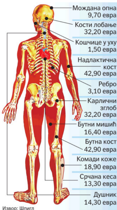
Слика 2.: Цене делова људског тела

претпоставља, позивајући се на изворе у Кијеву, да овај број може бити само већи, (Слика 2.). 15)