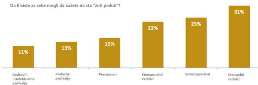
Графикон бр. 1.