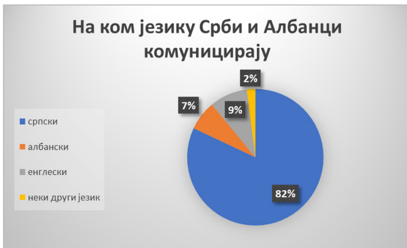
Слика 1: На ком језику Срби и Албанци комуницирају