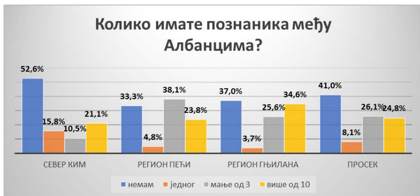
Слика 2: Колико имате познаника међу Албанцима?