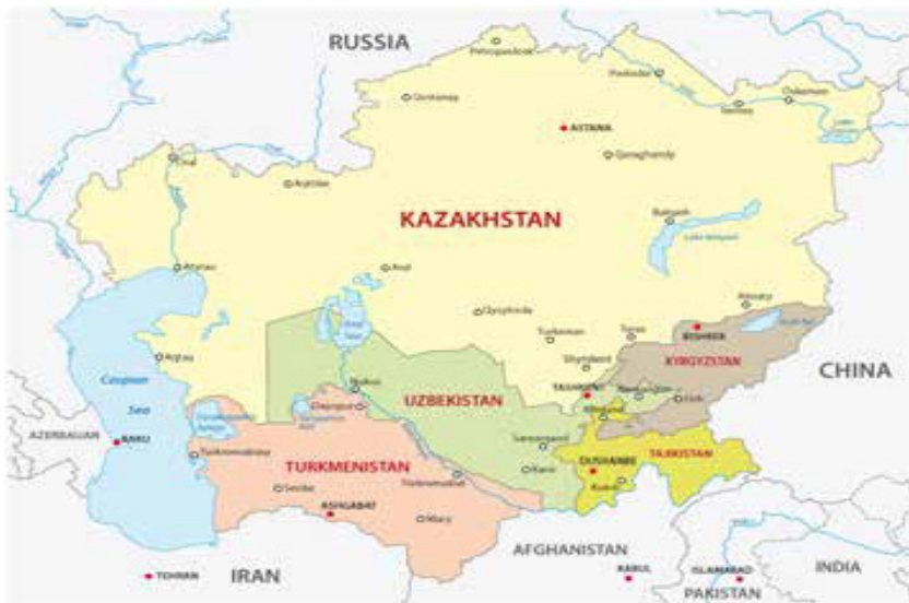
Слика 1: Централна Азија

Деликатан безбедносни проблем представља и постојеће надметање за регионалну доминацију или, како се то у последње време често фигуративно наглашава, Нова велика игра ( New Great Game ). За разлику од некадашње Велике игре у којој су била само два учесника, у геостратешком позиционирању у ЦА сада учествује њих неколико. Међу њима, три учесника се посебно издвајају по својим територијалним, демографским, економским и војним капацитетима, што је разлог да се ЦА додатно сагледа и из спољнополитичког угла НР Кине, Русије и Индије.