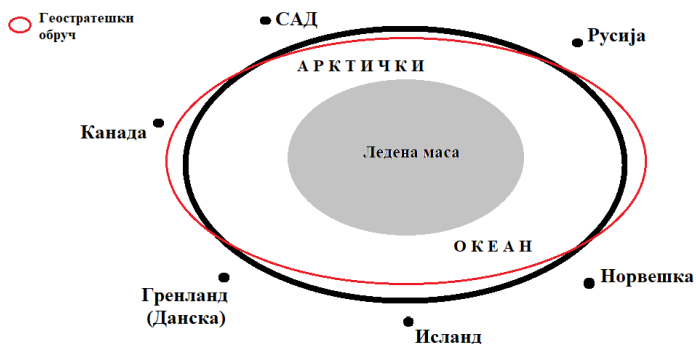
Слика 2. Арктички геостратешки обруч

морским путем, Москва може да заустави или чак уништи брод-уљез. То значи да је Русија de facto преузела контролу над Северним морским путем” (Bisenić 2021).