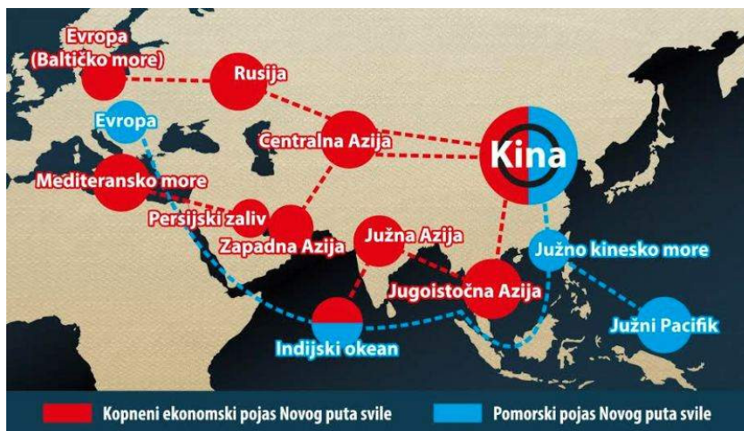
Слика 1. Нови пут свиле ( https://www.in4s.net/wp-content/uploads/2017/05/Novi-put-svile_mapa.jpg )

Конкретно пројекат „Појас и пут”, који треба да буде заокружен 2050. године, пре свега, јесте у економској сфери и подразумева велика инфраструктурна улагања у изградњу нових аутопутева, брже железнице, лука, енергетских и комуникационих постројења, чиме би се умрежила и повезала Азија са Европом и Африком. (Станисављевић, 2017). Успешна реализација овог инклузивног пројекта преобликовала би глобалну економску слику и допринела развоју земаља Евроазије.